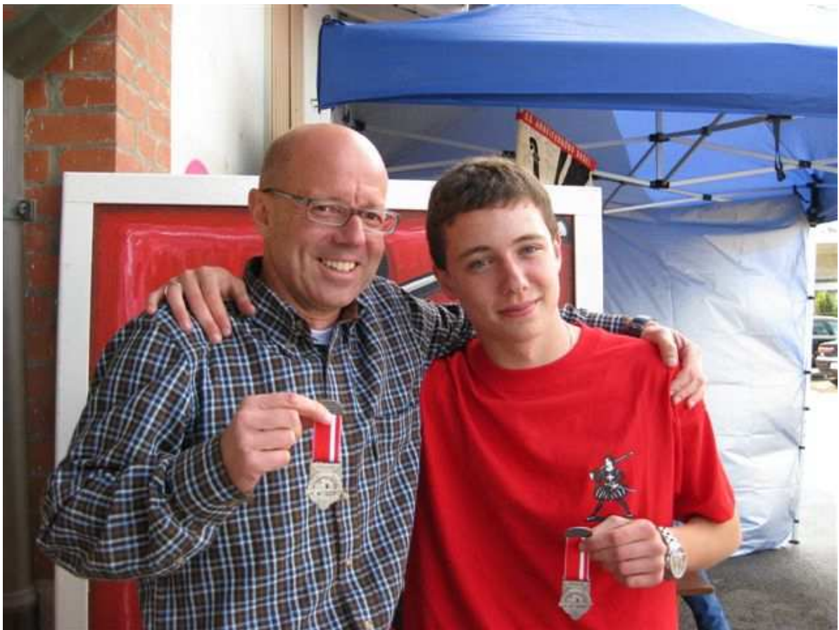
...und die Erlösung und Freude danach mit der verdienten Auszeichnung.