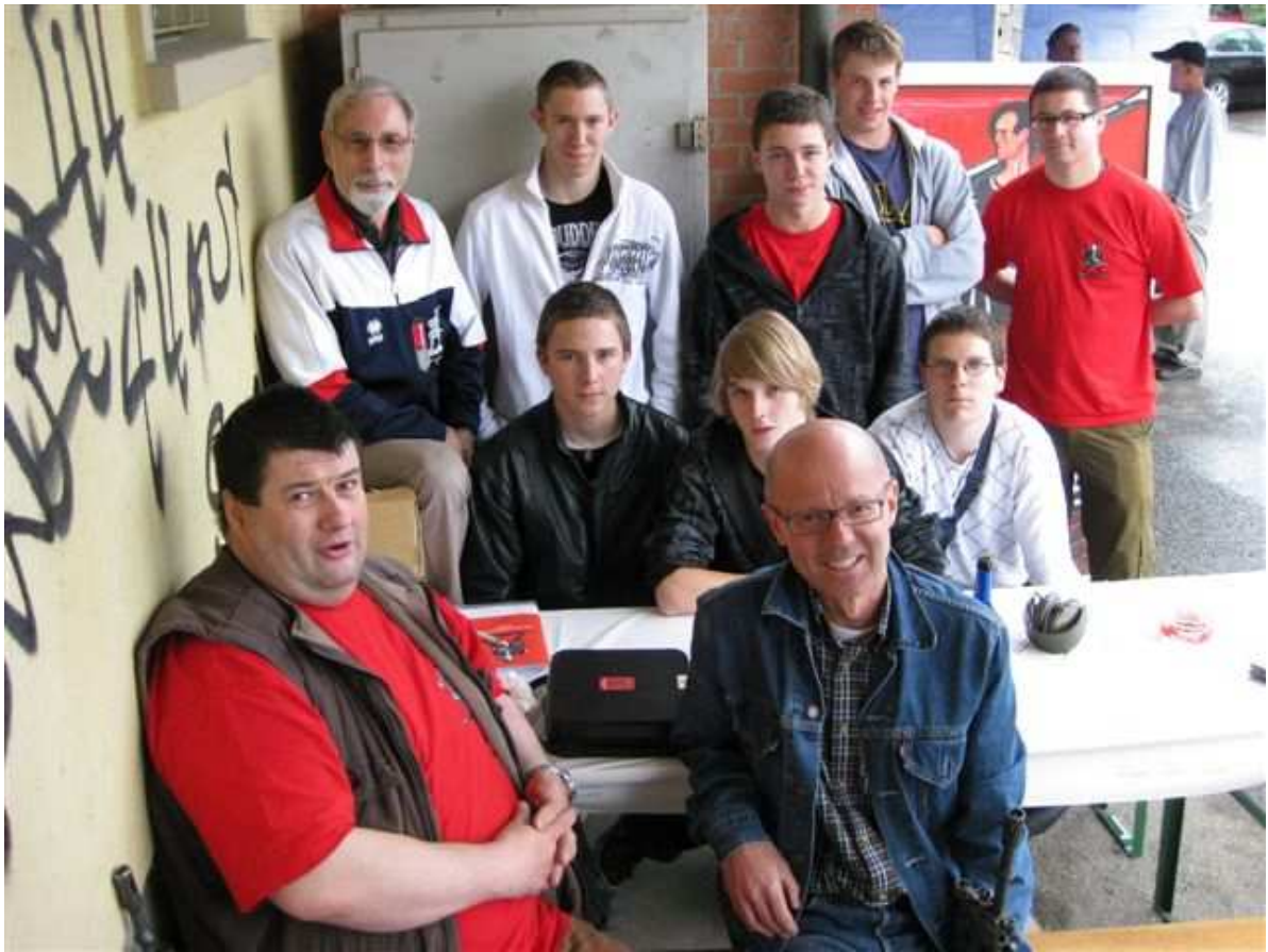
Die grosse Anspannung vor dem Einsatz...