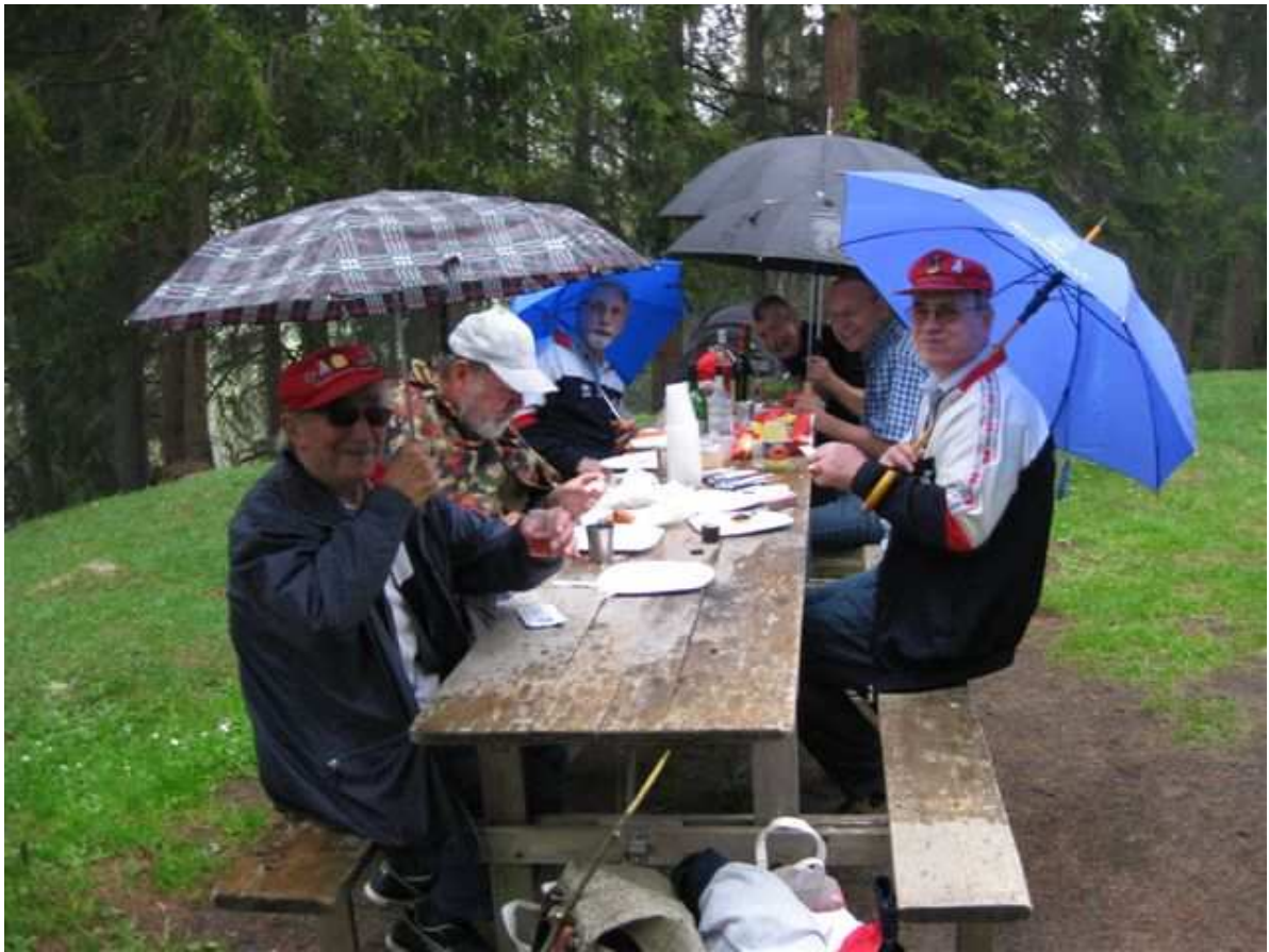
Für einmal brauchten die Feldschützen die Schirme nicht wegen der Sonne.