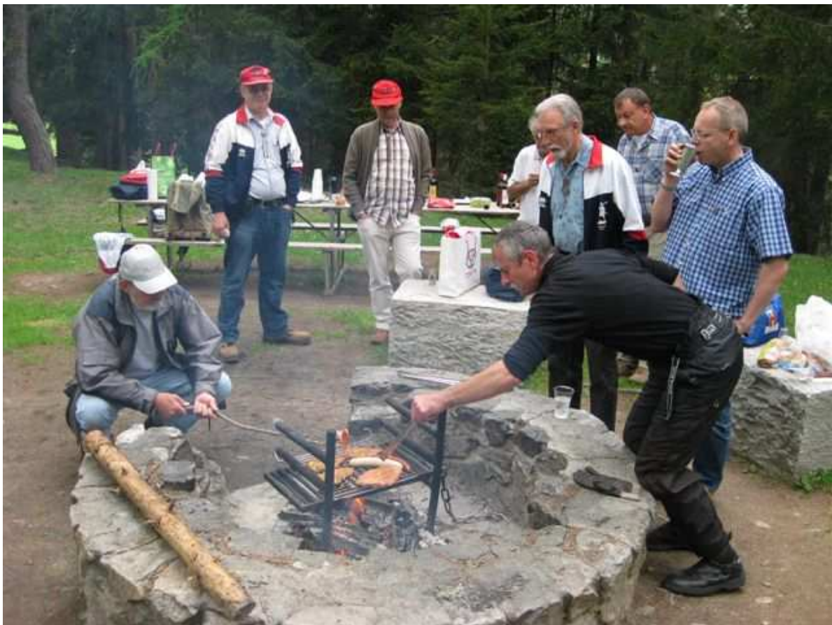
Pic-Nic auf dem Heidboden; das Wetter spielt noch mit.